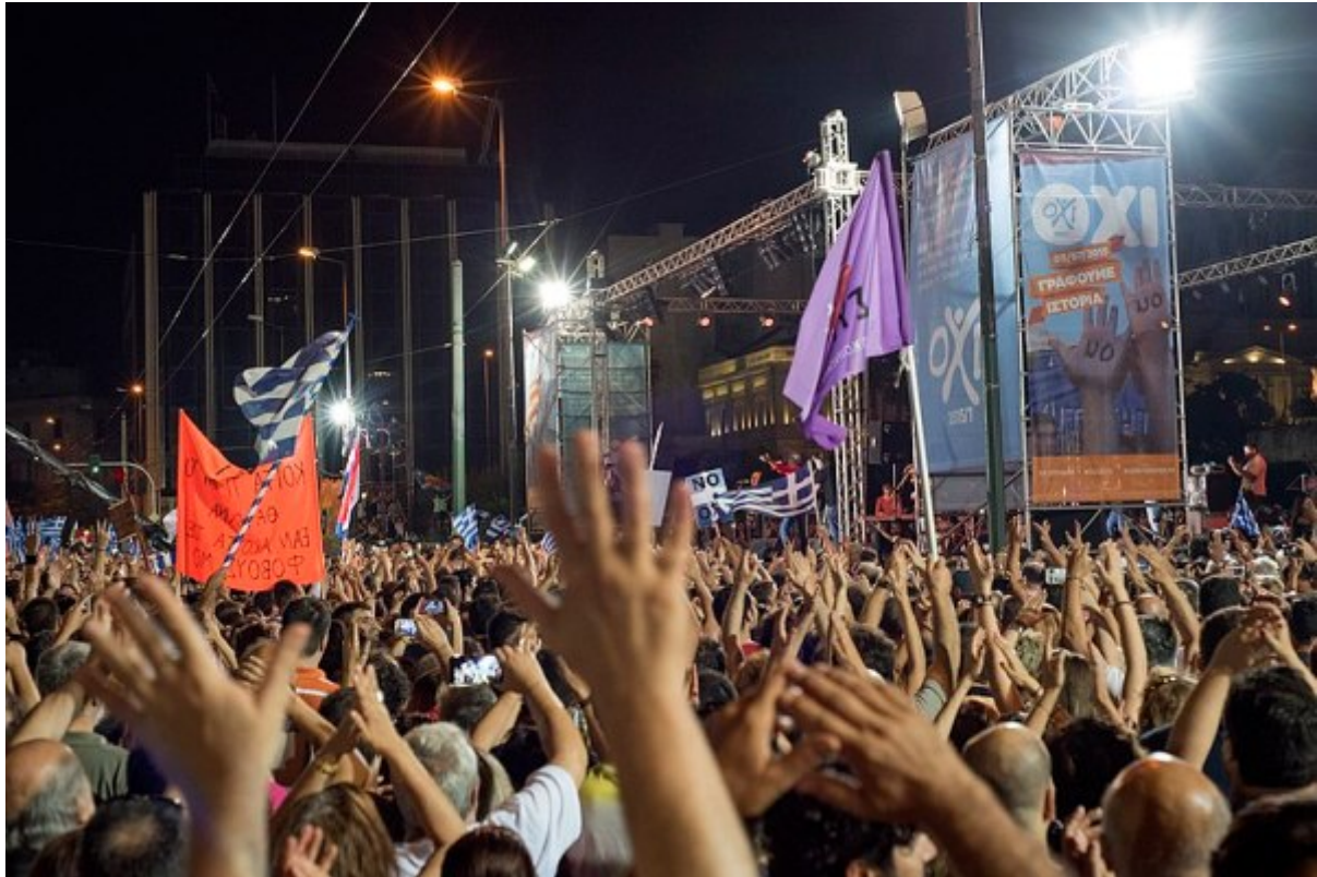
Betogers op het Syntagmaplein, Athene, op 3 juli 2015, twee dagen voor het 'OXI-referendum'

Gezien de ervaringen van 2015 is het van fundamenteel belang dat degenen die geen illusies hebben in de EU of de eurozone en die authentieke ecologische en socialistische perspectieven zien in een breuk met de EU, zoals die bestaat, krachtig worden gesteund. Het is duidelijk dat noch de EU noch de eurozone kan worden hervormd. Het is duidelijk dat het onmogelijk is om, op basis van de legitimiteit van het algemeen kiesrecht of het democratisch debat, de Europese Commissie, het IMF, de ECB en de conservatieve regeringen die in het grootste deel van Europa aan de macht zijn, aan te zetten tot het nemen van maatregelen die de rechten van het Griekse volk, of in het algemeen van de bevolking van welk land dan ook te eerbiedigen.