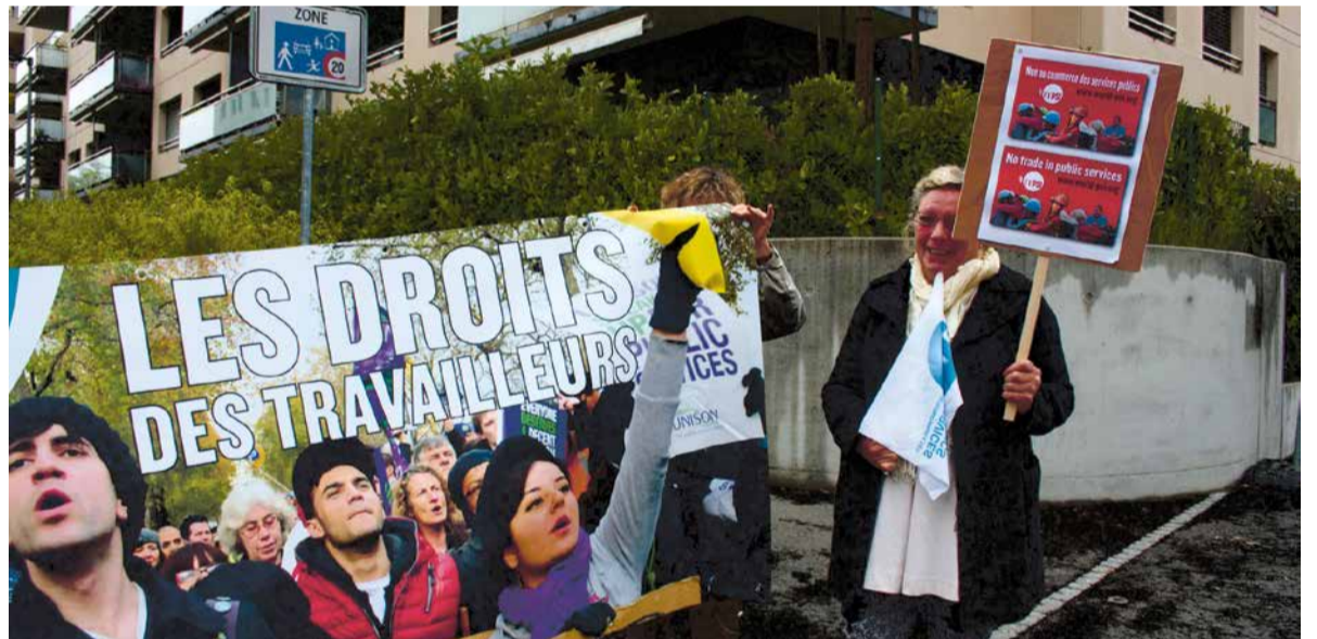
Demonstratie van PSI en Zwitserse bonden bij Australische missie in Geneve op 28 april 2014

Een internationale website met een overvloed aan informatie over dergelijke bilaterale handelsakkoorden is bilaterals.org