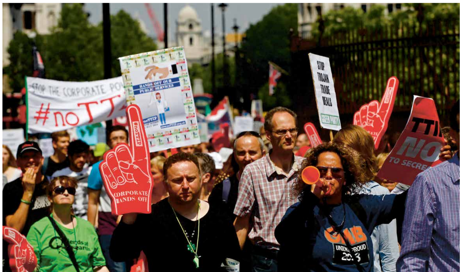
Demonstratie tegen TTIP in Londen op 12 juli 2014