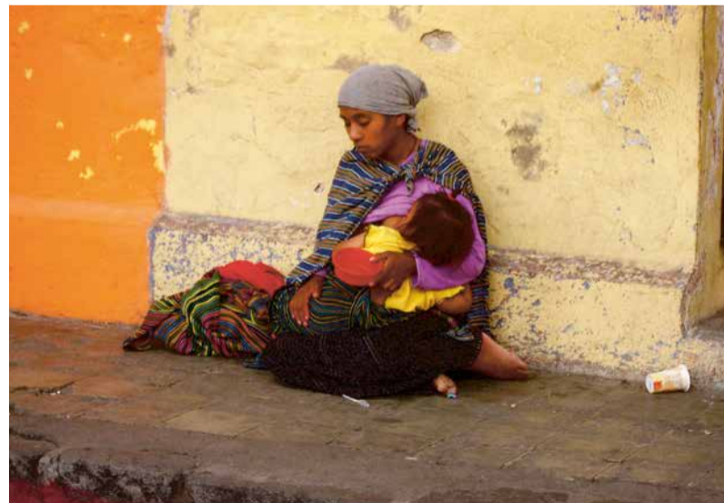
Borstvoeding in Guatemala

De toename van niet-overdraagbare aandoeningen, zoals diabetes, hart- en vaatziekten en kanker, is wereldwijd een groeiend probleem. Veel van deze aandoeningen zijn gerelateerd aan overgewicht die te maken heeft met de ingenomen voeding. Het vrijhandelsverdrag tussen de EU en de VS zal de handel in goedkoop en energierijk verwerkt voedsel en dus onze middelomtrek doen toenemen. Tegelijkertijd kent het handels-