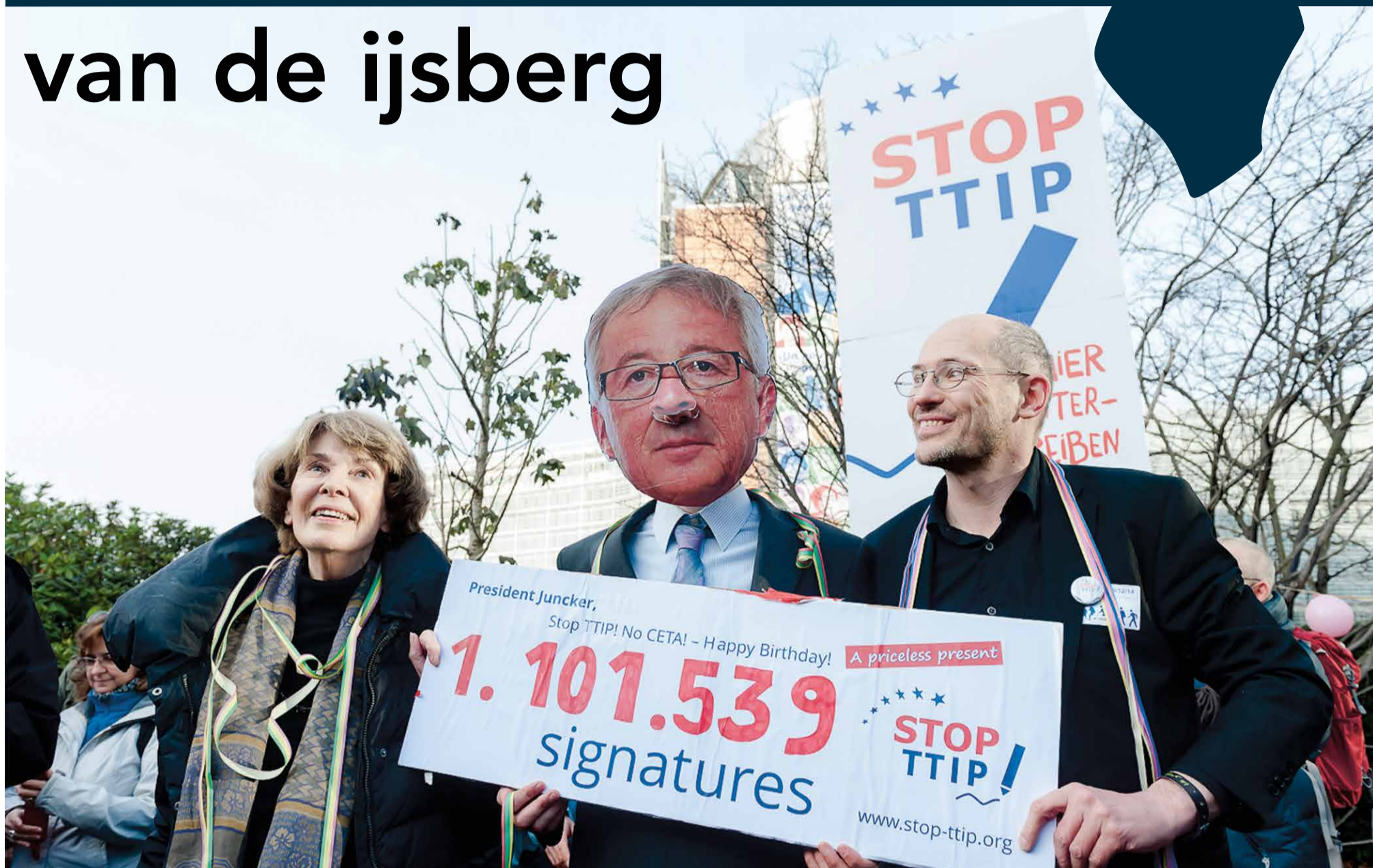
De eerste miljoen handtekeningen tegen TTIP van het "zelfgeorganiseerde burgerinitiatief" worden in december 2014 als verjaarscadeau naar EU Commissievoorzitter Juncker gebracht.